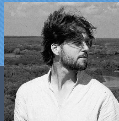
Марат ХУСНУЛЛИН режиссер фильма