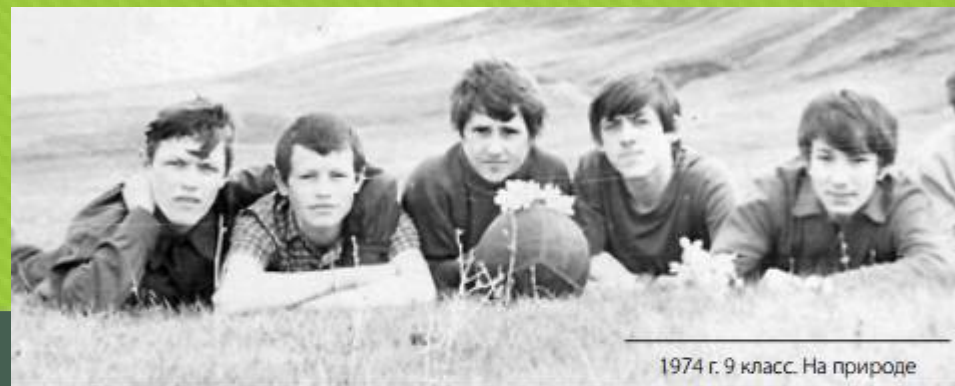
1974 г. 9 класс. На природе