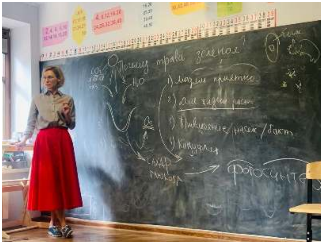
Антишкола "Искатели", 2020. gdeev9@gmail.com